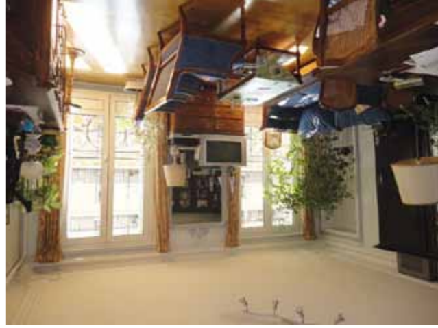
8 ème - Chaptal - 1 410 000 €

Bel immeuble en pierre de taille, 4 ème étage, ascenseur, appartement familial baigné de soleil, entrée, double séjour, grande cuisine dinatoire, office, 4 chambres (possibilité 5), salle de bains, salle d'eau, dressing.