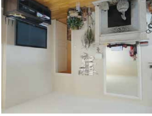
17 ème - Avenue Niel - 750 000 €

Immeuble haussmannien de standing, proche parc Monceau, appartement en triple exposition, entrée, double réception 54m 2 , cuisine dinatoire, 3 chambres dont suite parentale 44m 2 , salle de bains, 2 salles d'eau, dressing, buanderie.