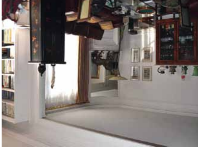
15 ème - Boucicaut - 867 000 €

Immeuble haussmannien, bel appartement familial en parfait état, exposé sud, belle vue dégagée sans vis à vis, entrée, vaste double séjour doté de balcons, cuisine dinatoire équipée, 2 chambres, bureau, salle de bains, dressing.