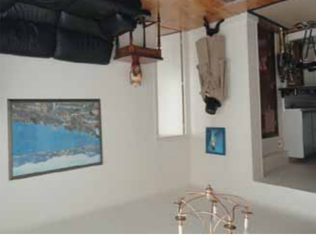
15 ème - Convention - 760 000 €

Bel immeuble pierre de taille, duplex traversant de 4 pièces situé aux derniers étages, calme et lumineux, balcon filant, entrée, double séjour, cuisine équipée, 2 chambres, 2 salles de bains. Chambre de service et box en supplément.