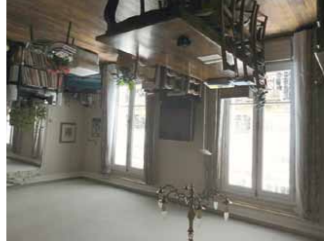
17 ème - Parc Monceau - 620 000 €

Immeuble ancien de bon standing, 4 ème étage, appartement rénové, entrée, grand séjour, cuisine américaine entièrement équipée, belle chambre, salle d'eau, nombreux rangements.