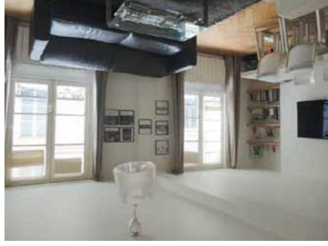
8 ème - Saint Augustin - 659 000 €

Bel immeuble en pierre de taille, 4 ème étage, ascenseur, appartement familial baigné de soleil, entrée, double séjour, grande cuisine dinatoire, office, 4 chambres (possibilité 5), salle de bains, salle d'eau, dressing.