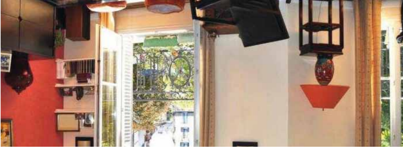
15 ème - Pasteur - 1 125 000 €

Immeuble haussmannien, appartement familial, très bon état, 1 er étage, galerie d'entrée, double réception, salle à manger, cuisine, 4 chambres, salle de bains, salle de douche. chambre de service de 8,5m 2 indissociable : 40 000 €. Possibilité parking en location.