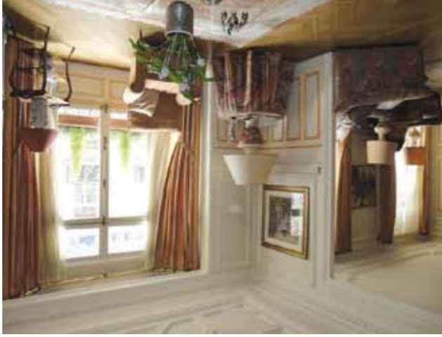
17 ème - Ternes - 2 090 000 €

Très bel immeuble haussmannien, appartement en parfait état, calme, belle hauteur sous plafond, entrée, double réception, cuisine dinatoire équipée, 3 chambres, 2 salles de bains. 2 parkings en location à proximité immédiate.