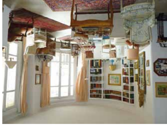
16 ème - Passy - 1 455 000 €

Immeuble pierre de taille, 4 ème étage, appartement familial, entrée, double séjour d'angle, salle à manger, cuisine dinatoire, 2 chambres, salle de bains, salle de douche, vendu avec 2 chambres service indissociables : 160 000€.