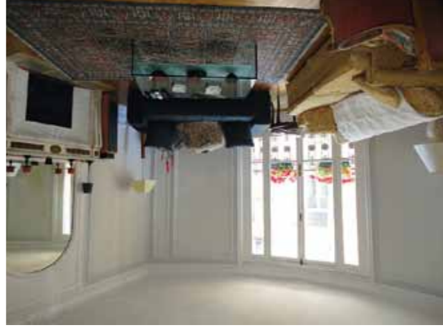
16 ème - Passy - 2 095 000 €

Immeuble pierre de taille, 4 ème étage, appartement familial, entrée, double séjour d'angle, salle à manger, cuisine dinatoire, 2 chambres, salle de bains, salle de douche, vendu avec 2 chambres service indissociables : 160 000€.