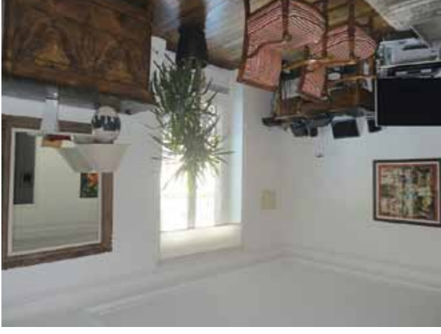
17 ème - Saint Ferdinand - 620 000 €

Immeuble ancien de standing, appartement en étage élevé, entièrement rénové en 2009, entrée, séjour, cuisine ouverte équipée, 2 chambres, possibilité double séjour + 1 chambre, salle d'eau. Exclusivité Breteuil.