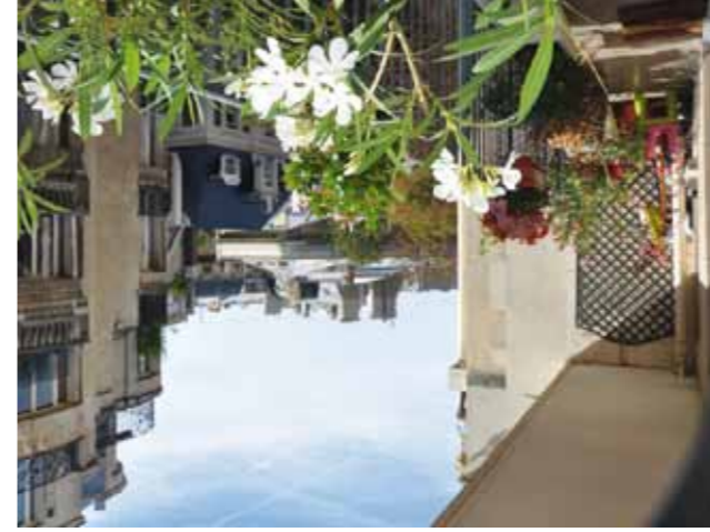
16 ème - Mairie du XVI e - 995 000 €

Très bel immeuble haussmannien, appartement en parfait état, beaux volumes, galerie d'entrée, double réception, salle à manger, cuisine, suite parentale, salle de bains, 2 chambres d'enfants, salle de douche, possibilité de créer une 4 ème chambre, studio de 22m 2 : 176 000 €.