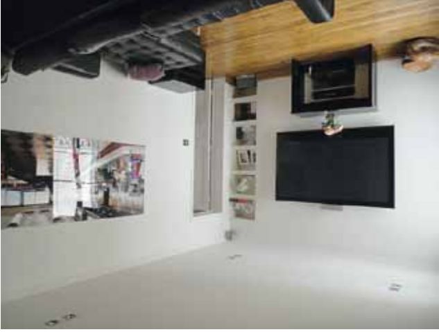
17 ème - Saint Ferdinand - 545 000 €

Immeuble de standing, au 6 ème et dernier étage sur une jolie cour arborée, appartement lumineux parfaitement distribué, entrée, séjour en double exposition, cuisine aménagée, 2 chambres, salle de bains. Exclusivité Breteuil.