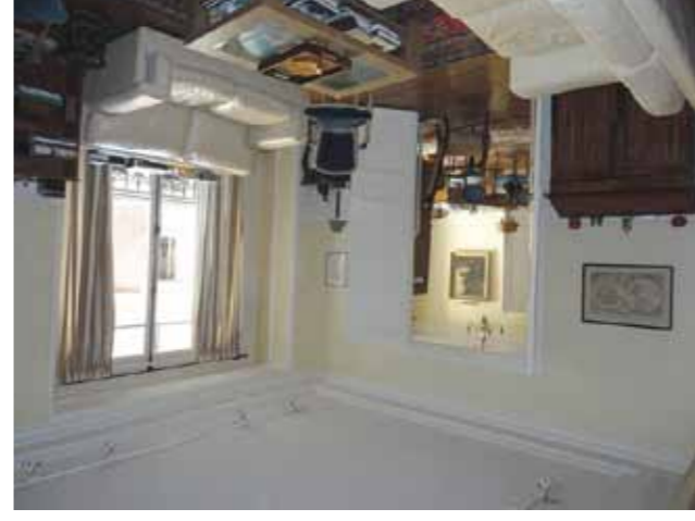
17 ème - Wagram - 1 320 000 €

Immeuble en pierre de Paris idéalement placé, bel appartement en bon état, parquet, moulure, cheminée, entrée, double séjour, cuisine séparée équipée, grande chambre (possibilité 2), salle de bains.