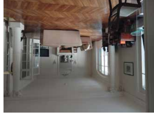
16 ème - Passy - 1 640 000 €

Immeuble récent de bon standing, 5 ème étage, appartement en parfait état, balcon filant 12m 2 , entrée, séjour, salle à manger, cuisine équipée, 2 chambres, dressing, salle de bains, salle de douche, rangements, parking: 45000€.