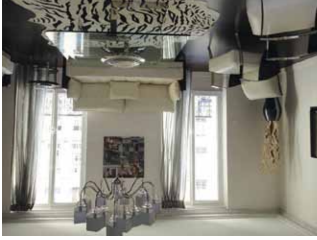
17 ème - Wagram - 2 590 000 €

Charmante maison de ville au cœur de la Mouzaia bénéficiant d'un vaste toit terrasse de 60m 2 , entrée, 1 er étage: séjour, cuisine, chambre, bureau, salle de bains, 2 ème étage: séjour, cuisine, chambre, salle de bains.