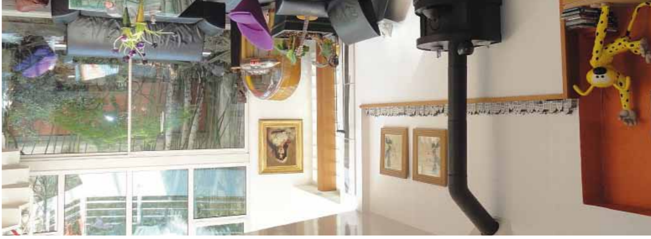
14 ème - Didot - 2 430 000 €

Maison de charme au calme sur 3 niveaux, entièrement rénovée. Entrée, vaste séjour cathédrale sur jardin, cuisine dinatoire, salon, bureau, 3 chambres dont une suite parentale sur terrasse de 24m 2 , 2 salles de bains, salle d'eau, buanderie.