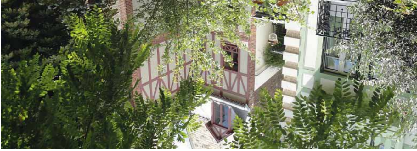
16 ème - Ranelagh - 3 950 000 €

Maison ancienne de charme en parfait état au calme, 183m 2 Carrez (208m 2 habitables), 2 terrasses arborées dont une de 71m 2 , entrée, double séjour, cuisine dinatoire, 4 chambres, bureau, salle de bains, 2 salles d'eau.