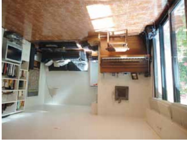
15 ème - Duplex - 1 180 000 €

Maison de charme au calme sur 3 niveaux, entièrement rénovée. Entrée, vaste séjour cathédrale sur jardin, cuisine dinatoire, salon, bureau, 3 chambres dont une suite parentale sur terrasse de 24m 2 , 2 salles de bains, salle d'eau, buanderie.