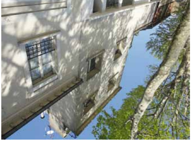
19 ème - Mouzaia - 1 370 000 €

Au cœur d'une impasse privée, belle maison ancienne sur jardin de 100m 2 , entrée, salon, salle à manger, cuisine dinatoire, 7 chambres, bureau, 3 salles de bains, 3 salles d'eau, buanderie, chambre de service. Emplacement de stationnement.